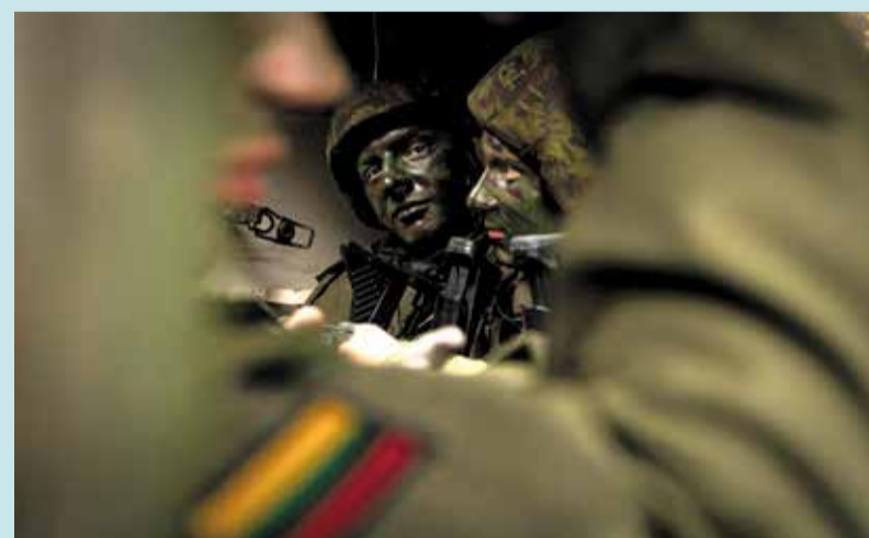
► „Kiekvienoje savivaldybėje yra už mobilizaciją atsakingi pareigūnai, kurie pagal turimus planus ir nurodytus poreikius atitinkamos grėsmės atveju informuos savivaldybės gyventojus apie jų teises, pareigas ir visas mobilizacijos priemones.“

Kiekviena savivaldybės administracija Vyriausybės nustatyta tvarka pasiruošusi vykdyti valstybės ir savivaldybių mobilizacijos planus ir mobilizacinius nurodymus. Kiekvienoje savivaldybėje yra už mobilizaciją atsakingi pareigūnai, kurie pagal turimus planus ir nurodytus poreikius atitinkamos grėsmės atveju informuos savivaldybės gyventojus apie jų teises,