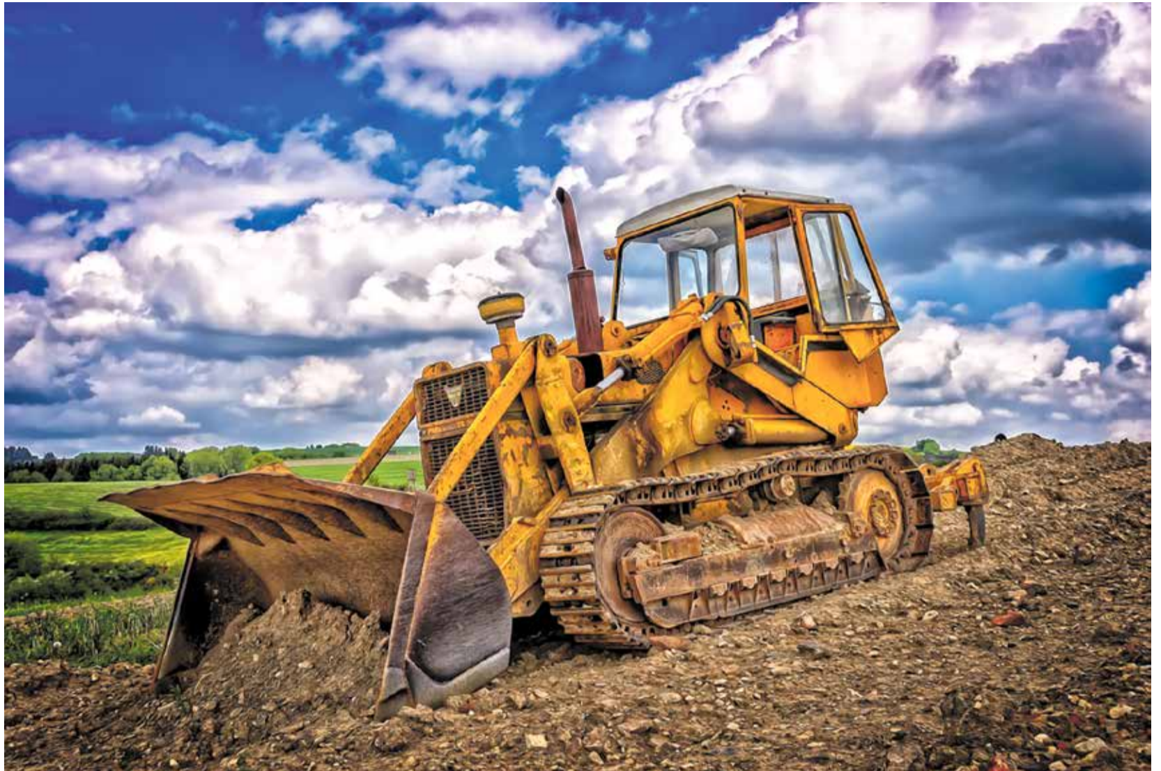
► Sveikatos įstaigų tinklo pertvarka – vienas ryškiausių įrodymų, kad valdantieji reformas „stumia buldozeriu“.

Vyriausybė nevykdo savo įsipareigojimų regionams dėl gerai išvystytos veikiančios infrastruktūros, efektyvaus judumo, darbo vietų, švietimo,